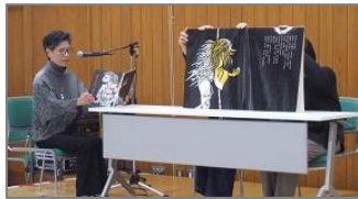
清水北公民館 自主グループ 芸能発表 (絵本deシアター 太極拳クラブ「凜」 清水民謡会)