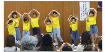
くりのみ児童館 発表 手話ダンス