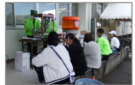
ポップコーン & 綿菓子コーナー