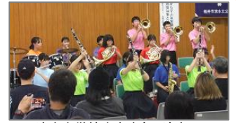
清水中学校吹奏楽部 演奏