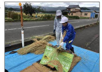
千歯こきを使って脱穀を体験しました。